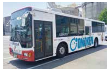
小野建株式会社様